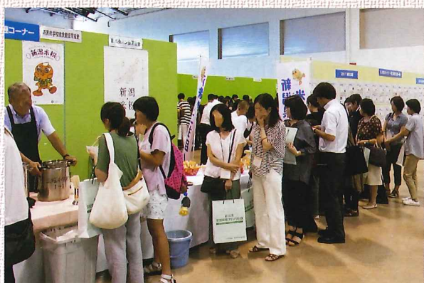
新潟県学校給食フェア2019 試食会の様子