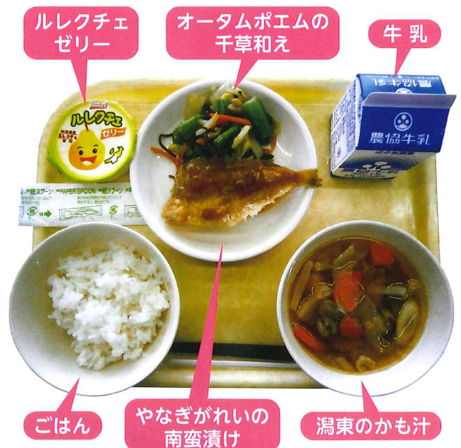
潟東のかも汁給食

試食会では、潟東地域の郷土食として親しまれてきた「かも汁」を中心とした「潟東のかも汁給食」をご来賓の皆さんと児童と一緒に会食しました。家庭でもかも汁を食べる機会は減っており、潟東の子どもたちに、いつまでも郷土の味を忘れないでいてほしいと願いを込めた給食です。できる限り市内産、県内産の食材を使用しました。