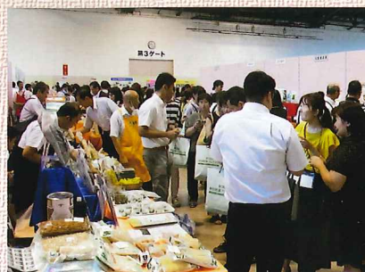
新潟県学校給食フェア2019の様子