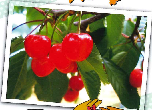
聖籠の さくらんぼ♪