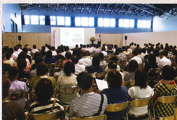
新潟県学校給食フェア2019 食育講習会の様子